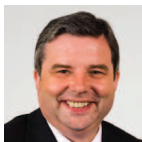
Dai Lloyd Gorllewin De Cymru Plaid Cymru