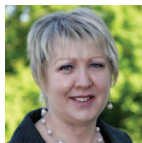
Eleanor Burnham Gogledd Cymru Democratiaid Rhyddfrydol Cymru