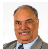
Mohammad Asghar Dwyrain De Cymru Y Ceidwadwyr Cymreig