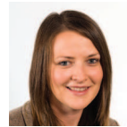
Bethan Jenkins Gorllewin De Cymru Plaid Cymru