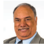
Mohammad Asghar Dwyrain De Cymru Ceidwadwyr Cymreig