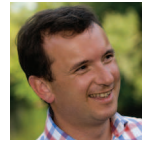
Alun Cairns Gorllewin De Cymru Ceidwadwyr Cymreig